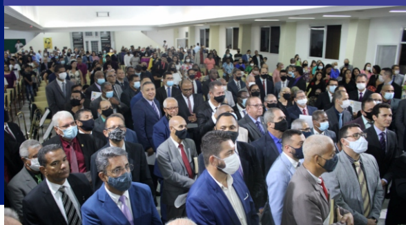
Culto em Ações de Graças pelo aniversário do Presidente da CADEESO e posse das Comissões, Conselhos e Secretarias

Parceria com a CGADB para implantação do sistema de gestão financeira e administrativa.